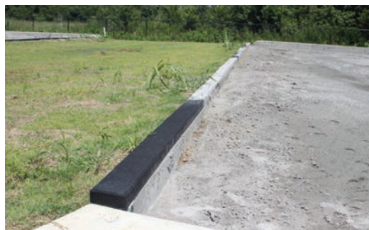
SUPERPOSITION DE BORDURE

La superposition en caoutchouc FlexEdge est un capuchon en caoutchouc de 2 po de hauteur qui peut être appliqué sur toute bordure de béton existante de 6 po. Cela pourrait être bénéfique dans les situations où il y a déjà une bordure en béton créant un risque pour la sécurité, comme dans les aires de jeux. Également, il peut être appliqué dans les nouvelles constructions, par exemple sur les installations de piste de course où les bordures D-zone peuvent être dangereuses pour les athlètes.